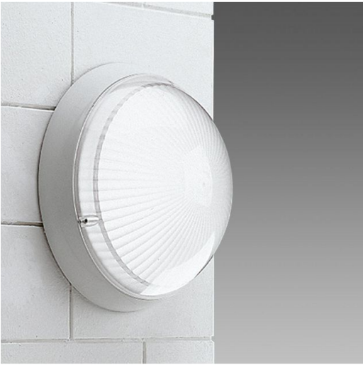
1544 Globo LED