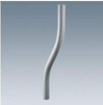
513 Brazo curvado para Aura