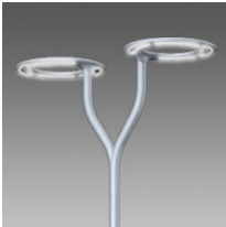
532 Brazo doble