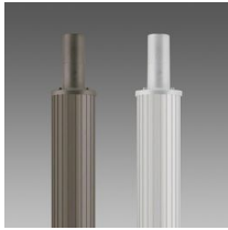
1509 Columna rayada ø120