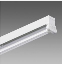
6402 Rapid system - monolámpara LED