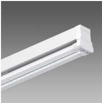
6502 Rapid system - bilámpara LED