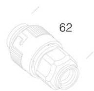
372 Enchufe para acoplamiento rápido