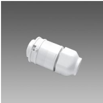
371 Enchufe para acoplamiento rápido