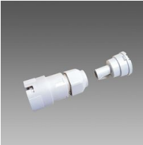
370 Conexión para tubo diám.20