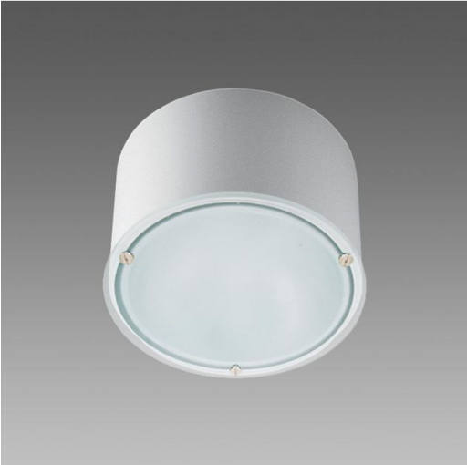
781 Compact - con SENSORE